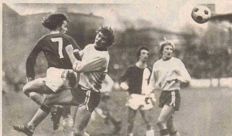
Zu den bemerkenswerten Resultaten, die Wismut Aue vor heimischer Kulisse erzielte, zählte auch das 0:0 gegen Jena. Dabei besaß der Gastgeber viele Chancen — auch durch J. Körner (links), der Schnuphase überspringt.