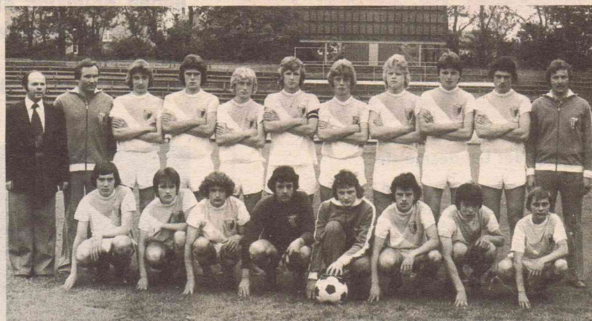
DDR-Jugendmeister 1976/77: FC Karl-Marx-Stadt