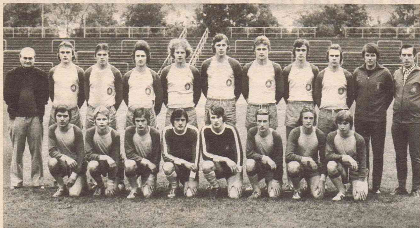
DDR-Juniorenmeister 1976/77: 1. FC Lok Leipzig